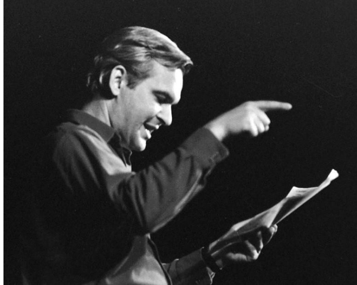
Latinovits Zoltán verset mond a Holmi c. irodalmi esten. Egyetemi Színpad, 1972